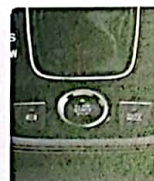
BOTÓN ENCENDIÓ / AUTOHOLD / PARKING