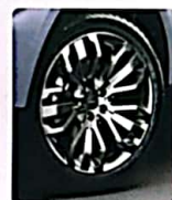
NEUMÁTICOS RIN 20