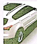
ASISTENTE EN PENDIENTE (HAC)