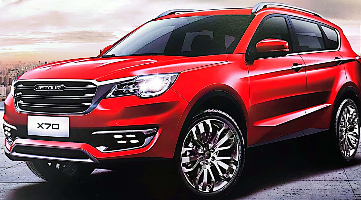
IMAGEN PUBLICITARIA. USO PROMOCIONAL