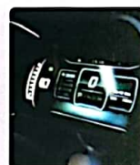
PANEL DIGITAL DE INSTRUMENTOS 12.3"