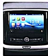
PANTALLA MULTIMEDIA 10"